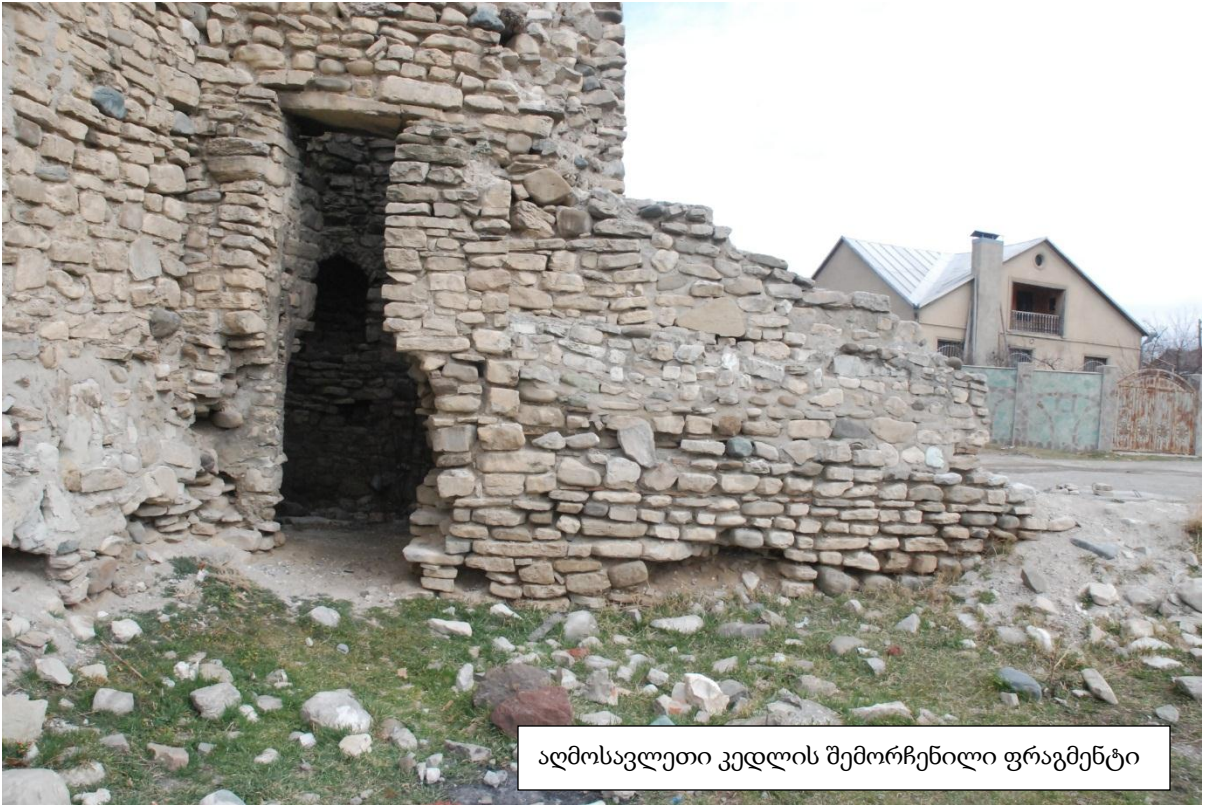
ალმოსავლეთი კედლის შემორჩენილი ფრაგმენტი