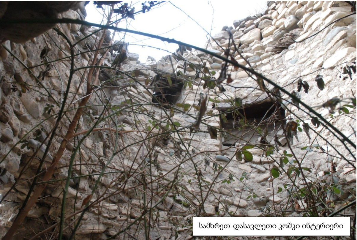
სამხრეთ-დასავლეთი კოშკი ინტერიერი