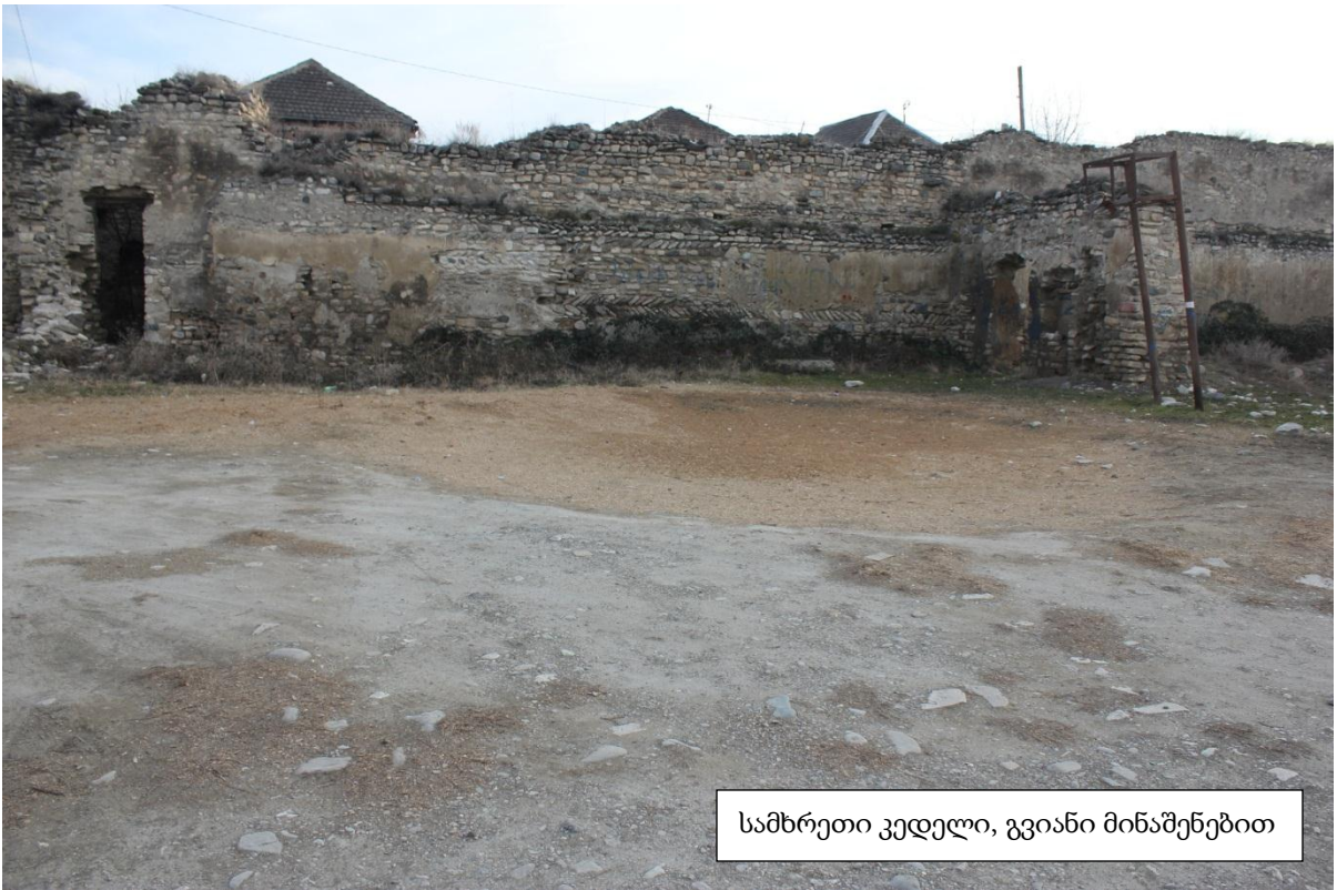
სამხრეთი კედელი, გვიანი მინაშენებით