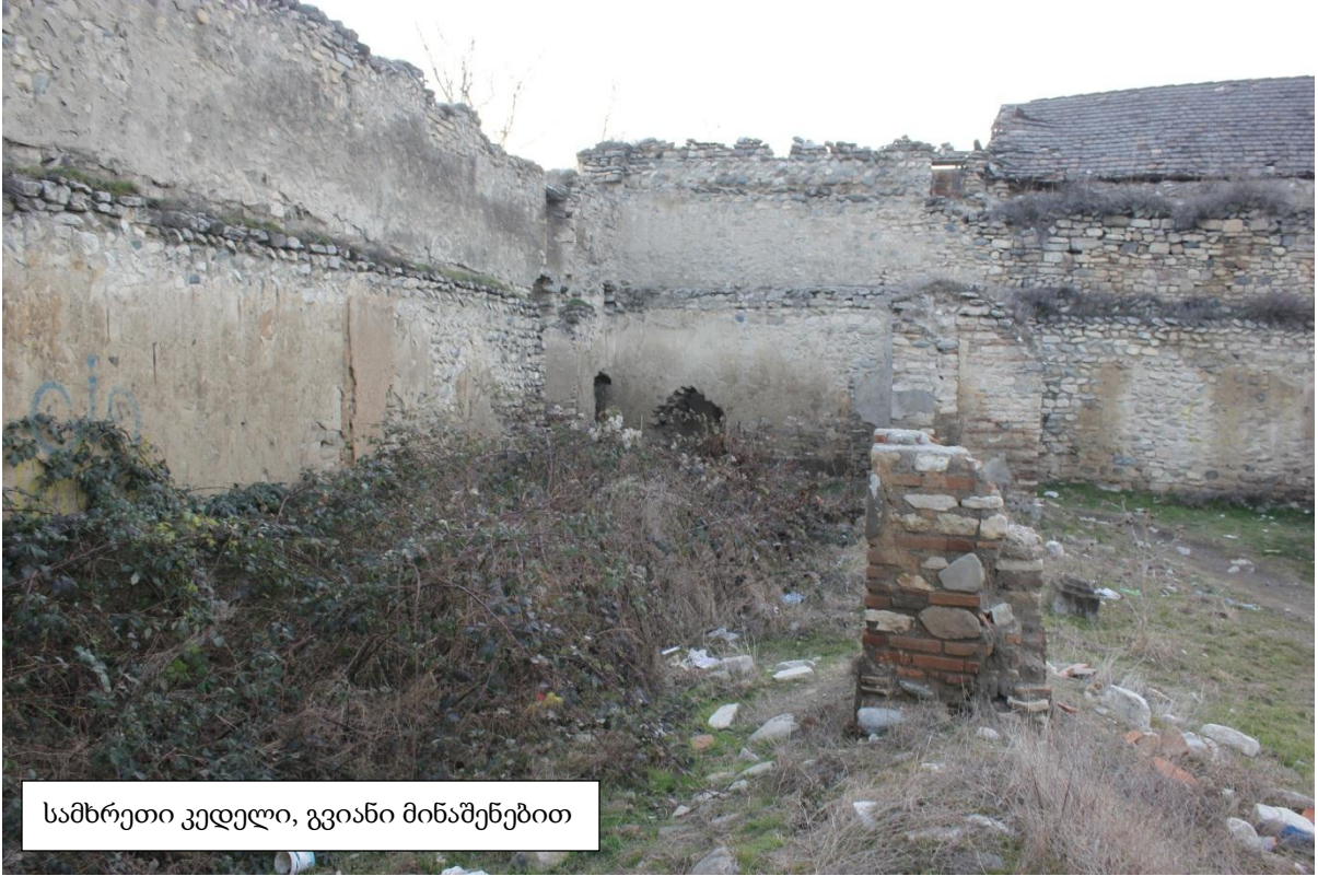
სამხრეთი კედელი, გვიანი მინაშენებით