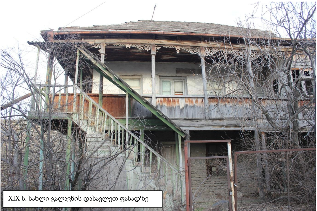
XIX ს. სახლი გალავნის დასავლეთ ფასადზე