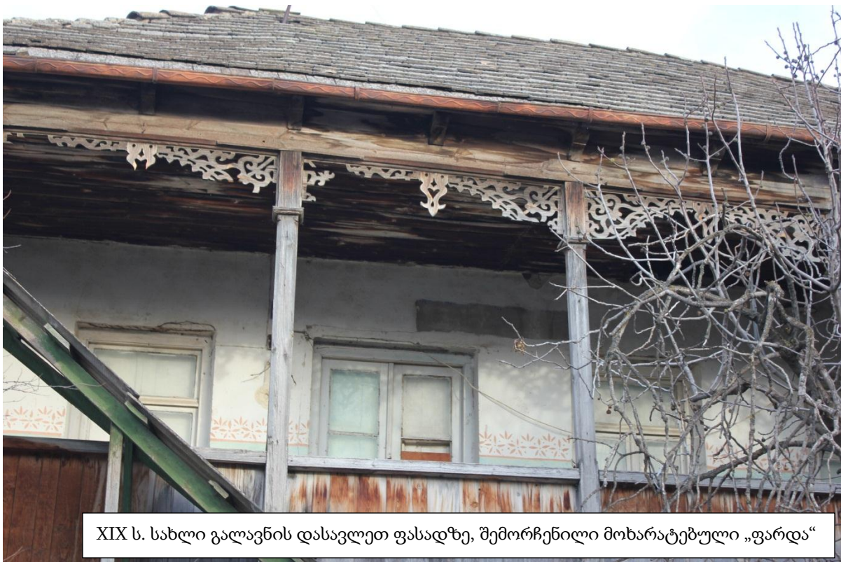
XIX ს. სახლი გალავნის დასავლეთ ფასადზე, შემორჩენილი მოხარატებული „ფარდა“