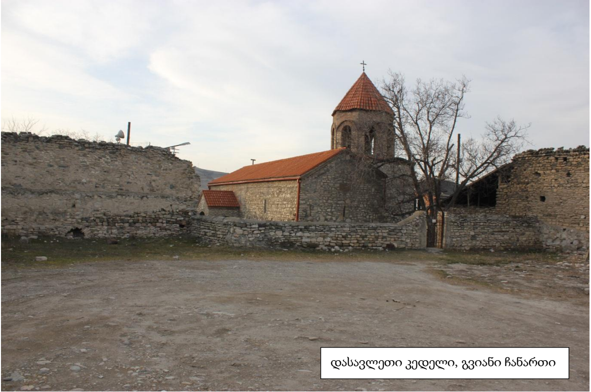
დასავლეთი კედელი, გვიანი ჩანართი