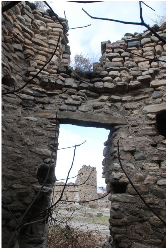
სამხრეთ-აღმოსავლეთი კოშკი ინტერიერი