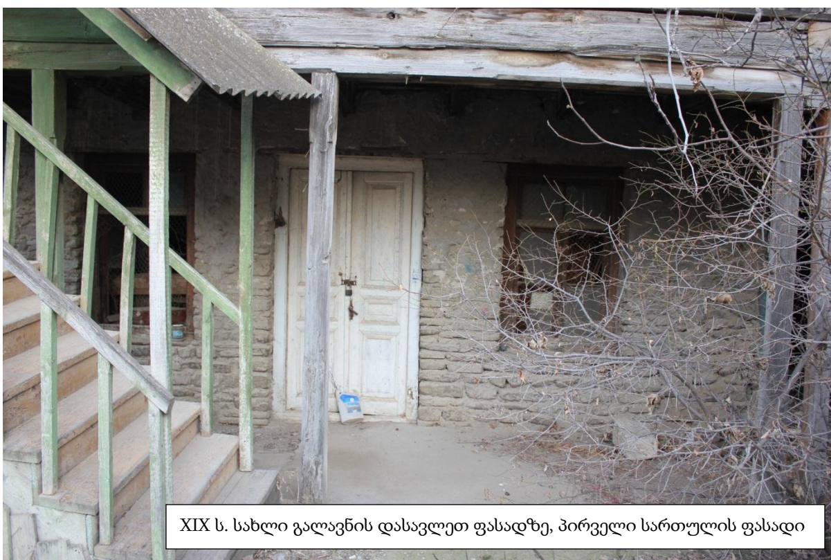
XIX ს. სახლი გალავნის დასავლეთ ფასადზე, პირველი სართულის ფასადი