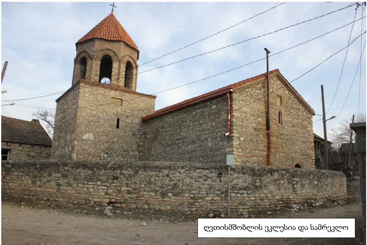
ღვთისმშობლის ეკლესია და სამრეკლო