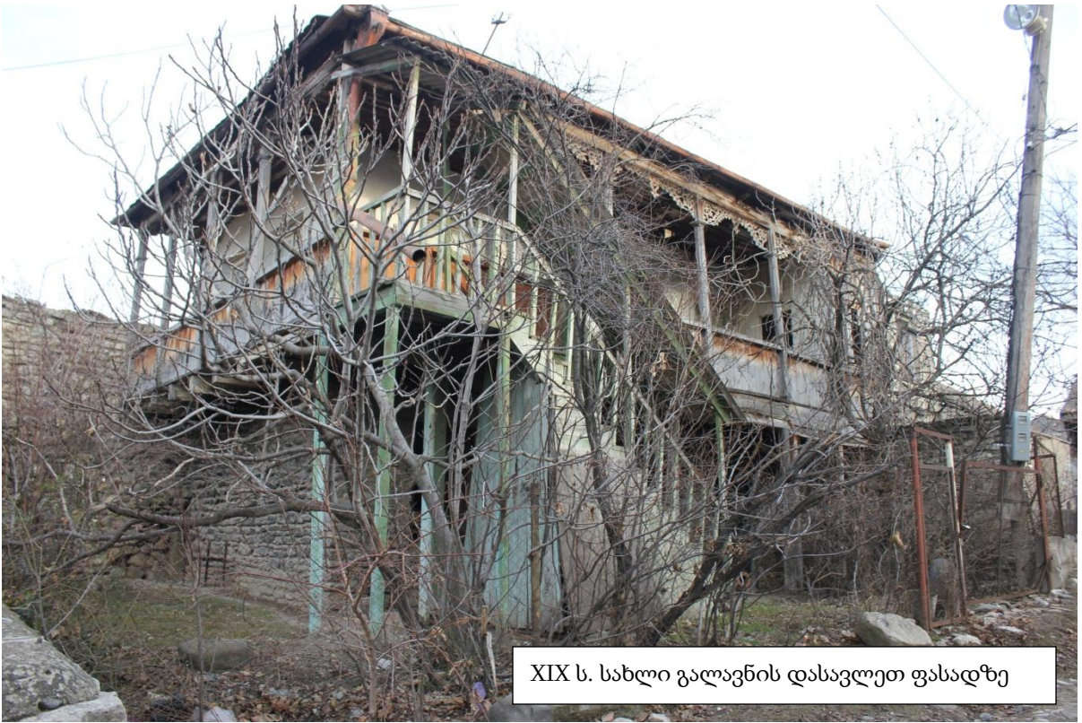
XIX ს. სახლი გალავნის დასავლეთ ფასადზე