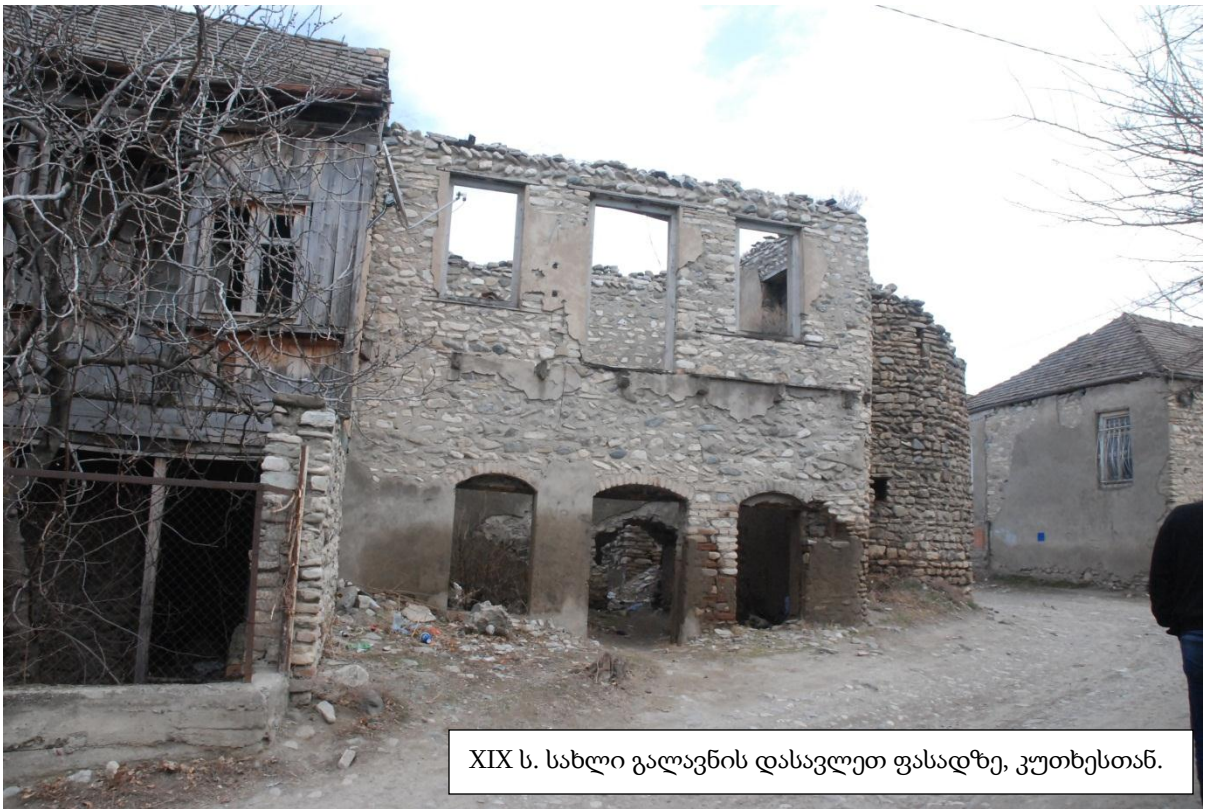
XIX ს. სახლი გალავნის დასავლეთ ფასადზე, კუთხესთან.