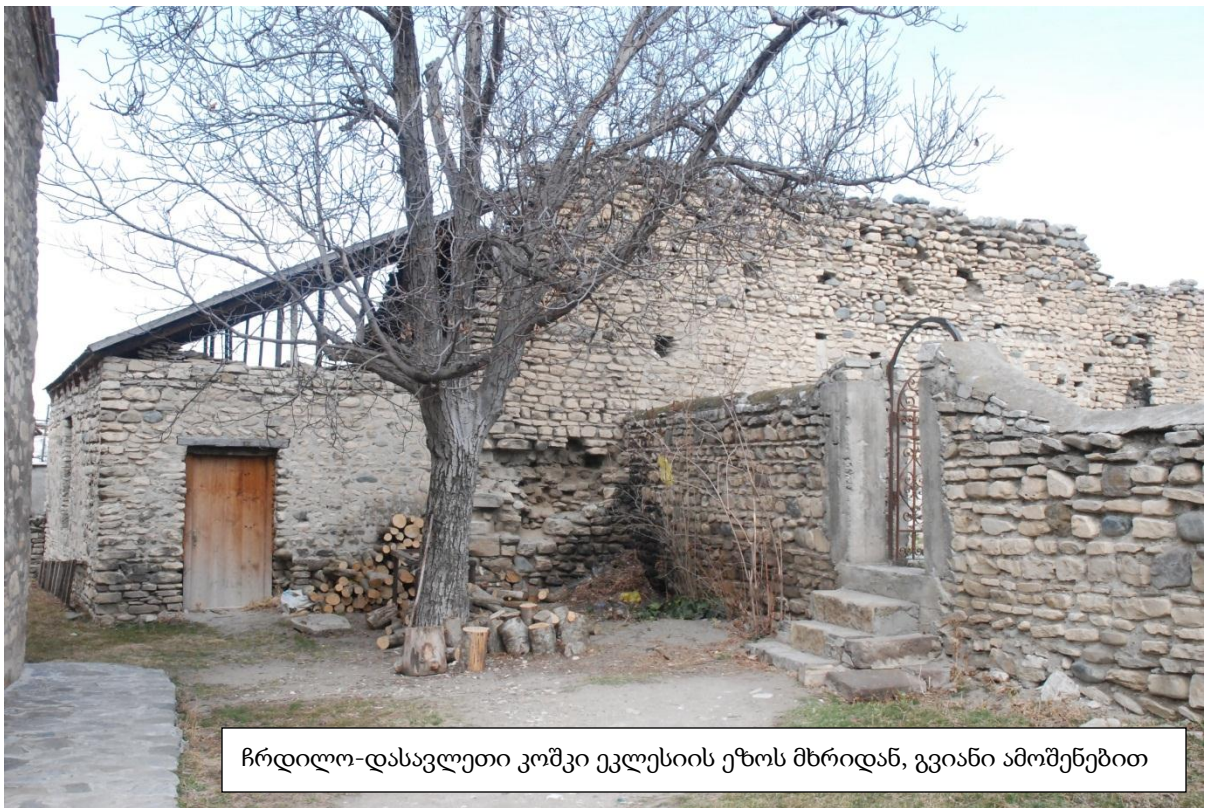
ჩრდილო-დასავლეთი კოშკი ეკლესიის ეზოს მხრიდან, გვიანი ამომუნებით