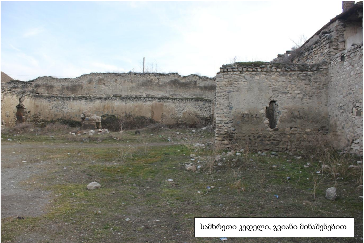
სამხრეთი კედელი, გვიანი მინაშენებით