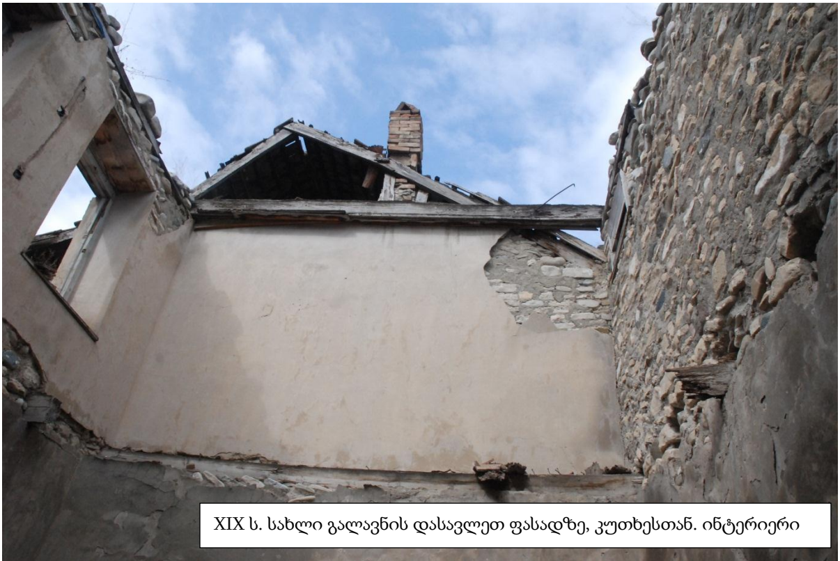
XIX ს. სახლი გალავნის დასავლეთ ფასადზე, კუთხესთან. ინტერიერი